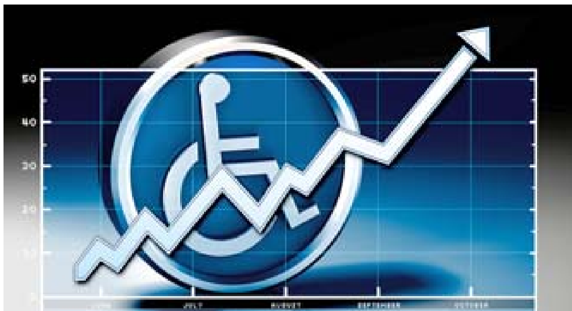
Noventa y siete empresas han contratado a casi 3.000 discapacitados desde 1997.

Para Acciona, la gestión del empleo de personas con discapacidad no es sólo una obligación legal sino un reflejo de su responsabilidad so-